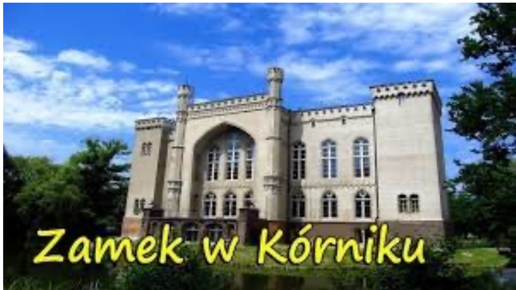
Zamek w Kórniku